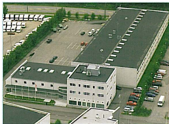
Scanoffice Oy:n toimisto ja logistiikkakeskus käsittää yhteensä noin 2600 m 2 nykyaikaista toimitilaneliötä.

Mestarintie 4 01730 Vantaa Puhelin (09) 290 2240 Telefax (09) 290 1213 www.scanoffice.fi